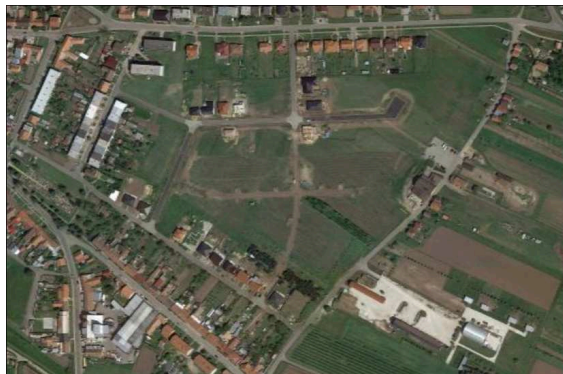
Stav využití stavebních parcel a zastavěnost v lokalitě (září 2017)