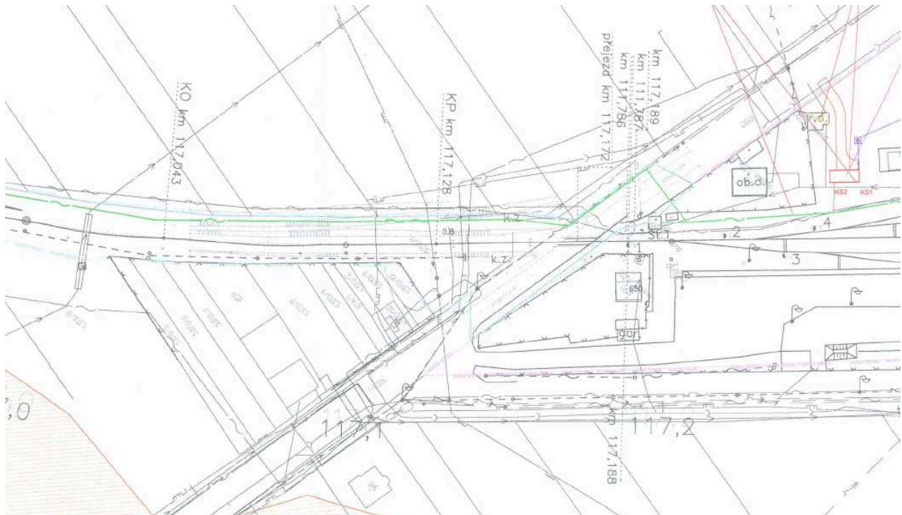
Výřez Koordinačního situačního výkresu ÚR